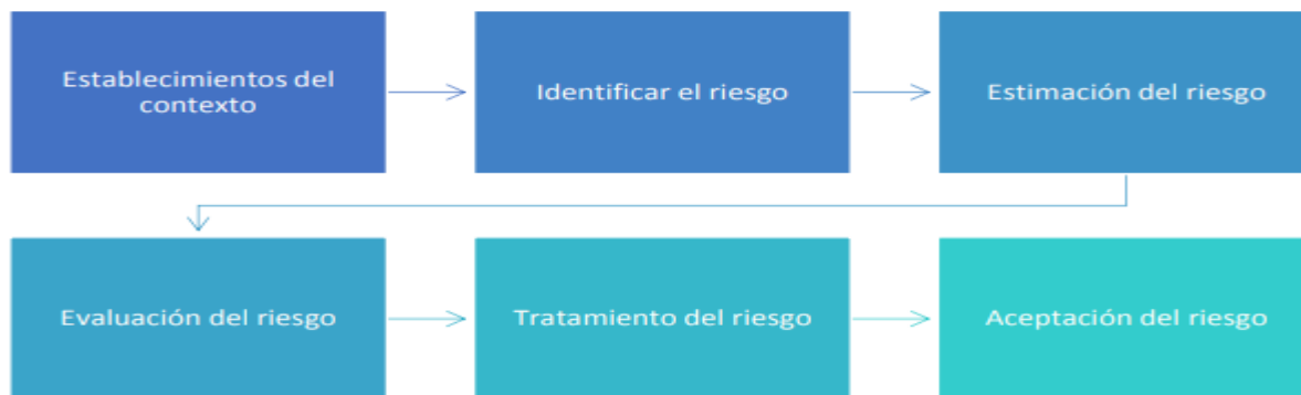
Ilustración 1. Estructura general de la metodología de riesgos